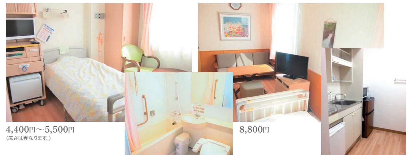
4,400円～5,500円 (広さは異なります。)